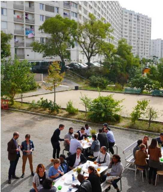
Déjeuner de rencontre entre 25 chefs d'entreprise et 25 personnes en recherche proactive d'emploi (Octobre 2018)