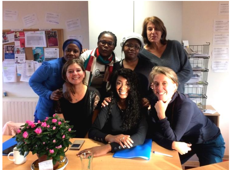
Atelier « Comment une entreprise recrute ? » en présence d'une chef d'entreprise